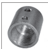
Ms Muffe mit 2 x M4 Quergewinde