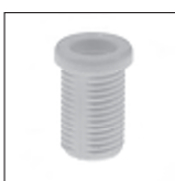
Ku Trompetennippel mit Verdrehsschutz