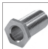
Ms 6kt. Trompetennippel ohne Verdrehenschutz