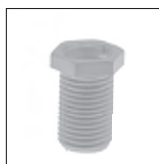
Ku 6kt. Trompetennippel ohne Verdrehsschutz