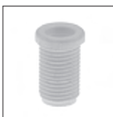
Ku Trompetennippel ohne Verdrehsschutz