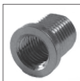
Ms Reduzier Trompetennippel mit Verdrehenschutz