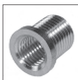
Ms Reduzier Trompetennippel ohne Verdrehenschutz