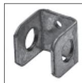
FE Auslass ohne Erdungsschraube