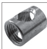
Ms Auslass ovale Fräsung