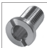
Ms Trompetennippel mit Schlitz ohne Verdrehenschutz