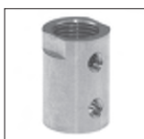
Ms Muffe mit 2 x M4 Quergewinde u. Schlüsselfräsung