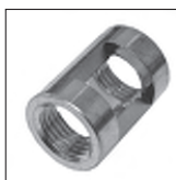
Ms Auslass 4kt. Fräsung