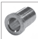
Ms Trompetennippel ohne Verdrehenschutz