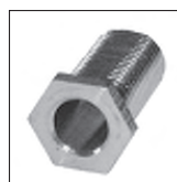
Ms 6kt. Trompetennippel mit Verdrehenschutz