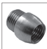
Ms Reduzier Nippel konisch (Kopfstück)