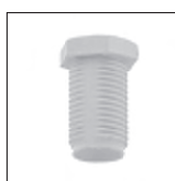
Ku 6kt. Trompetennippel mit Verdrehsschutz