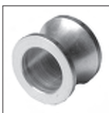
Ms Hohlkehle (Zwischenstück)