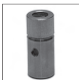
Ms Teleskop-Versteller mit PVC-Hülse