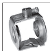
FE Auslass mit angenieteter Erdungsbuchse