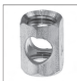
Ms 6kt. Auslass