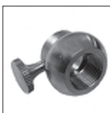
Ms Rohrversteller incl. Rändelschraube 12x15