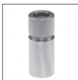
Ms Teleskop-Versteller mit PVC-Hülse